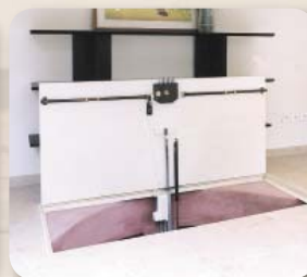
| Biztonsági csapóajtó