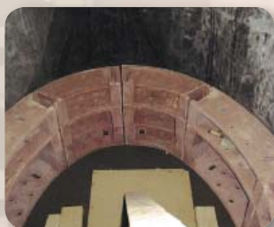
| Szektorelemek szerelése