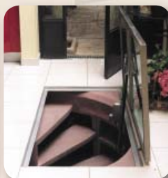
| A padlólemez helyreállítása