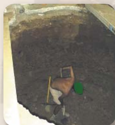
| A munkagödör kiemelése